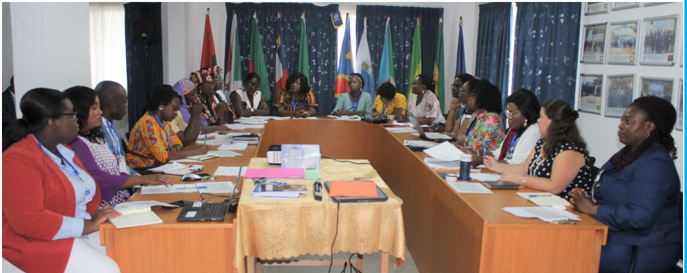
▲ L'atelier a réuni plusieurs organisations de la société civile. Celles-ci ont saisi cette occasion pour formuler un plaidoyer en faveur de la promotion de la participation des femmes dans la prise de décision en raison de leur rôle stratégique dans le processus de stabilisation et de consolidation de la paix.

La salle de conférence du Bureau régional des Nations Unies pour l'Afrique centrale (UNOCA) a servi de cadre, le 31 octobre 2019, à la commémoration au Gabon du 19ème anniversaire de la Résolution 1325 sur les femmes, la paix et la sécurité. L'UNOCA a notamment apporté son soutien aux ONG « Malachie » et « Gabon Groupe Résolution 1325 » lors d'un atelier qui a permis de passer en revue les réalisations et les défis relatifs à la mise en œuvre de ladite résolution.