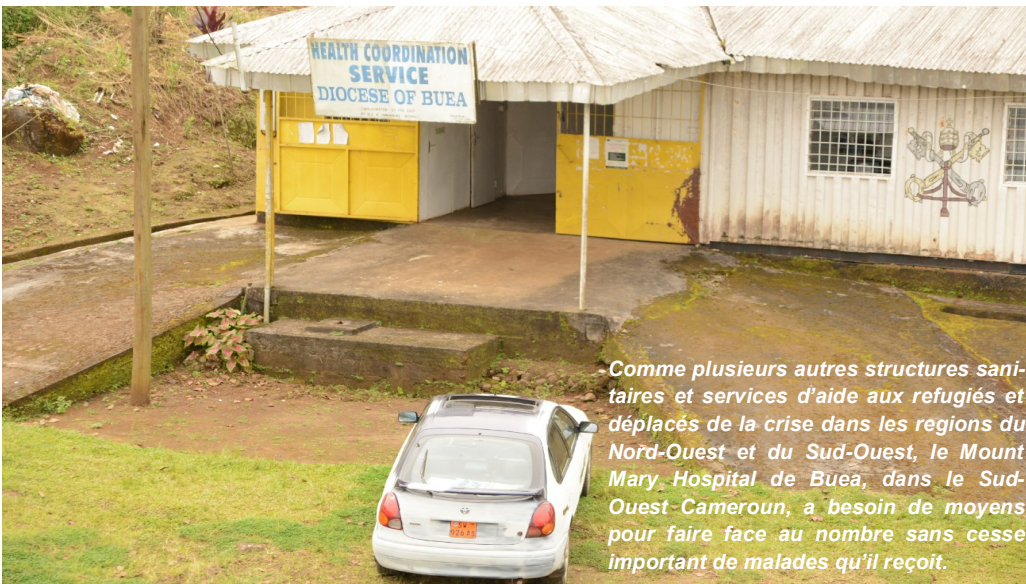
Comme plusieurs autres structures sanitaires et services d'aide aux réfugiés et déplacés de la crise dans les régions du Nord-Ouest et du Sud-Ouest, le Mount Mary Hospital de Buea, dans le Sud-Ouest Cameroun, a besoin de moyens pour faire face au nombre sans cesse important de malades qu'il reçoit.

Devant le Conseil de sécurité, le Représentant spécial/Chef de l'UNOCA a attiré l'attention sur la situation sécuritaire dans les trois provinces qui ont une frontière commune avec la Libye et le Soudan et sont en état d'urgence, indiquant qu'elle « représente toujours un risque pour la consolidation d'une paix durable ». Il a aussi fait savoir que cette situation nécessite « un engagement multiforme continu, spécialement au moment où le Tchad poursuit ses préparatifs en vue de la tenue d'élections législatives longtemps reportées et prévues maintenant pour le premier trimestre de l'année [2020] et la tenue de l'élection présidentielle en 2021 ».