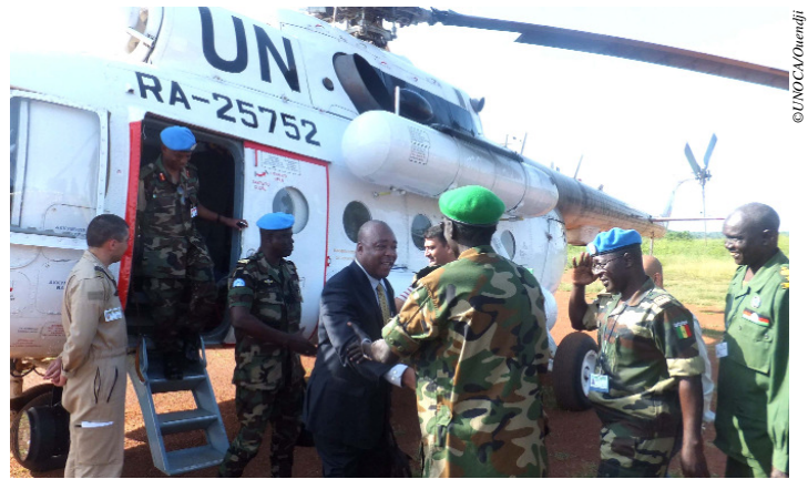
Arrivée et accueil de M. Abou Moussa à Yambio le 18 septembre

18 septembre 2012, Yambio (Soudan du Sud) - 2000 éléments de l'UPDF - Uganda People's Defence Force (Forces de défense du peuple ougandais) et 500 autres de la SPLA - Sudan People's Liberation Army (Armée populaire de libération du Soudan) ont été officiellement mis à la disposition de la Force régionale d'intervention de l'Union africaine (FRI/UA) chargée de lutter contre l'Armée de résistance du Seigneur (LRA). Le Représentant spécial du Secrétaire général de l'ONU et Chef de l'UNOCA a pris part à cet événement qui intervenait une semaine après celui d'Obo (RCA) où, le 12 septembre 2012, 360 éléments des Forces armées centrafricaines (FACA) avaient déjà intégré la FRI/UA. Il a également eu une séance de travail avec la Représentante spéciale et Chef de la Mission des Nations Unies au Soudan du Sud (UNMISS), Mme Hilde Johnson. Le Chef de l'UNOCA a aussi visité la radio Miraya à Juba, la capitale. Il a discuté avec ses animateurs de l'importance de cette chaîne dans la sensibilisation et la diffusion des programmes de défection visant les membres de la LRA. M. Abou Moussa a par ailleurs accordé une interview à la rédaction anglaise de Radio France internationale (RFI).